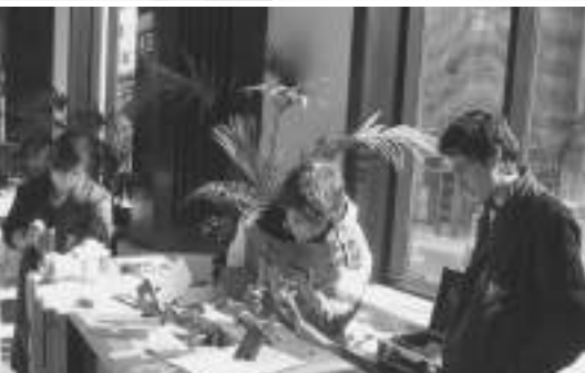
Seleccionadas 4 zonas rurales de las provincias de Ourense, León, Badajoz, Cáceres y Sevilla.