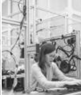
Participa en un proyecto de innovación social, financiado por el Fondo Social Europeo